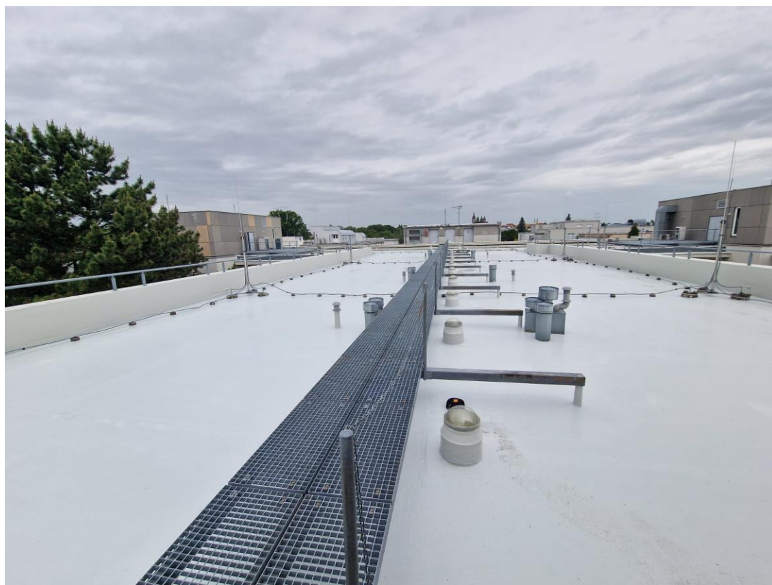
Fakultní nemocnice Hradec Králové